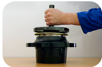
Abb. 5 · Montagewerkzeug aufsetzen