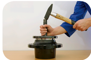
Abb. 6 · Polrad einpressen