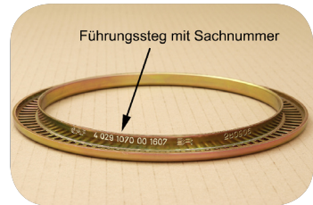
Abb. 1 · Führungssteg auf Polradunterseite

Anhand der auf dem Führungssteg an der Unterseite des Polrades eingepprägten Sachnummer (Abb. 1) lässt sich erkennen, wie viele Zähne das vorliegende Polrad hat. Polräder mit 80 Zähnen haben die Sachnummer 04 029 1069 00 und Polräder mit 90 Zähnen die Sachnummer 04 029 1070 00.