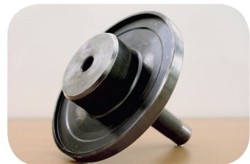
Abb. 2 · Montagewerkzeug

SAF-Montagewerkzeug für das Polrad (Abb. 2)