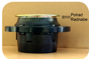
Abb. 7 · Richtig montiertes Polrad