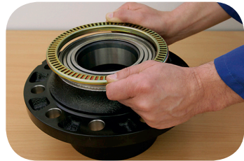
Abb. 4 · Polrad plan aufsetzen