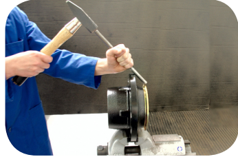
Abb. 3 · Polrad lösen