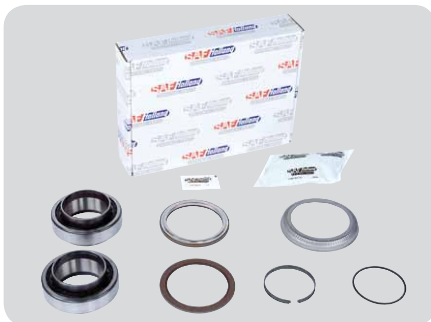
Obr. s pólovým kruhem