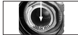
Abb. 3: Typenschild fehlt

Alle Richtzeiten werden laufend nach technischen Erfordernissen aktualisiert. Die Aktualisierungen finden Sie unter: