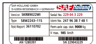
Abb. 2: Ab Mitte 2004