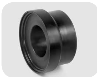
Montagedorn Lagerring und Polrad 1 434 3321 00