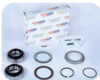
Abb. mit Polrad