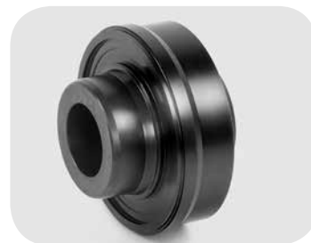
Montagedorn Dichtung 1 434 3322 00