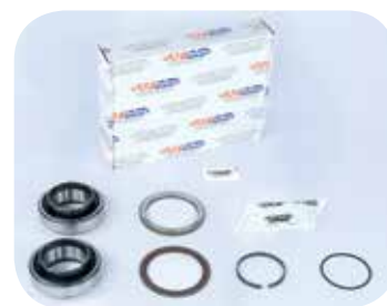
Abb. ohne Polrad