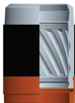
KNORR SN6: Offenes Loslager