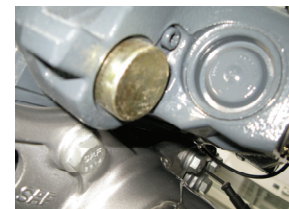
KNORR SN7: geschlossenes DU-Lager

Die entsprechenden Ersatzteil-Kits für die oben aufgeführten Bremsen werden ebenfalls auf die neuen Loslager-Abdeckungen umgestellt.