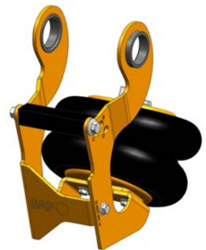
Darstellung von Achslift - 03 027 1278 01